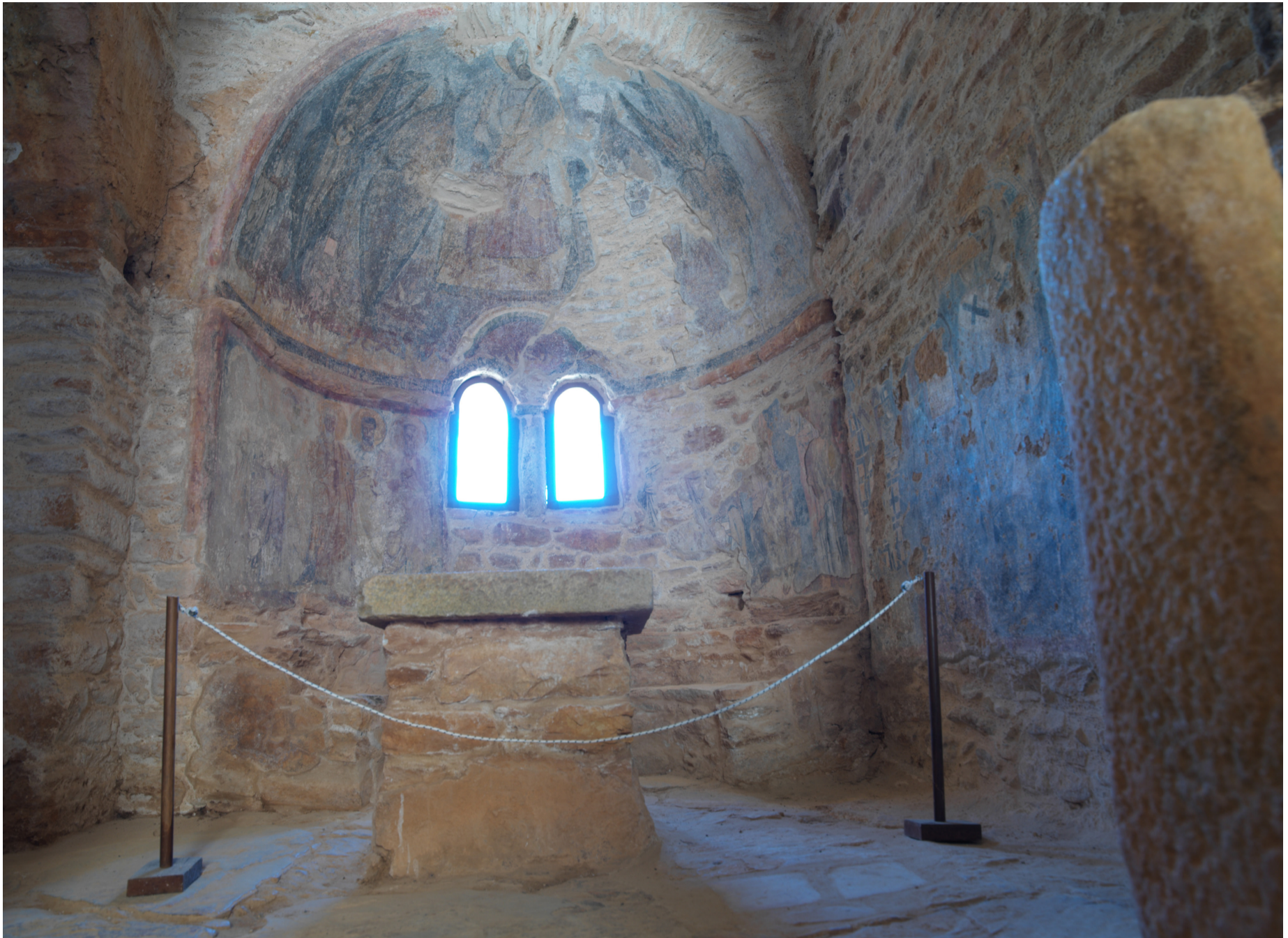
Apsis med freskomalerier fra 600 år e.kr

Church of Taxiarches at Monoitsia ligger ca 2km til fots fra Hagios Georgios Diasoritis. Dette er en tre skipet basilika kirke hovedsakelig bygget i lokal sandstein og marmor. Her er det eldste freskomaleriet i apsis datert til 600 år e.kr.