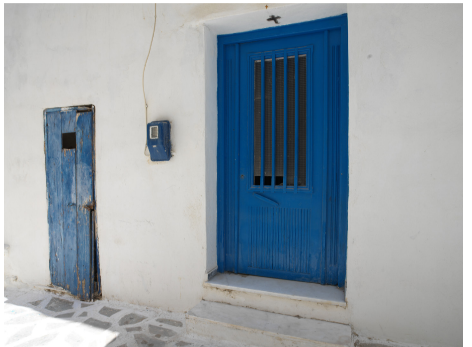
Nymalt og gammel estetikk side om side i Chora Old Town.

Vel tilbake til Norge sitter jeg igjen med en stolthet av å kunne bringe og formidle dette malehåndverket til neste generasjon.