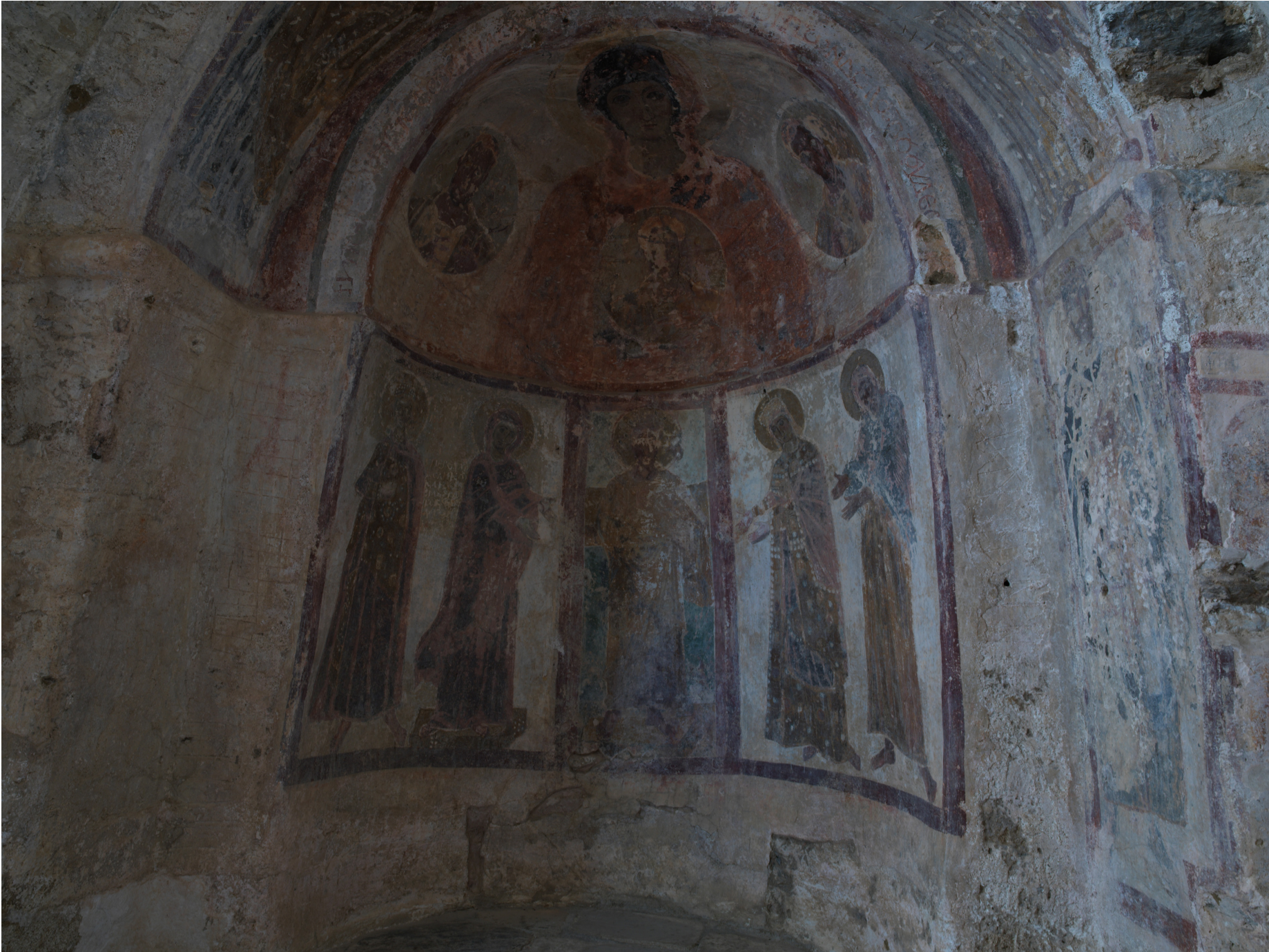
Apsis nord vest