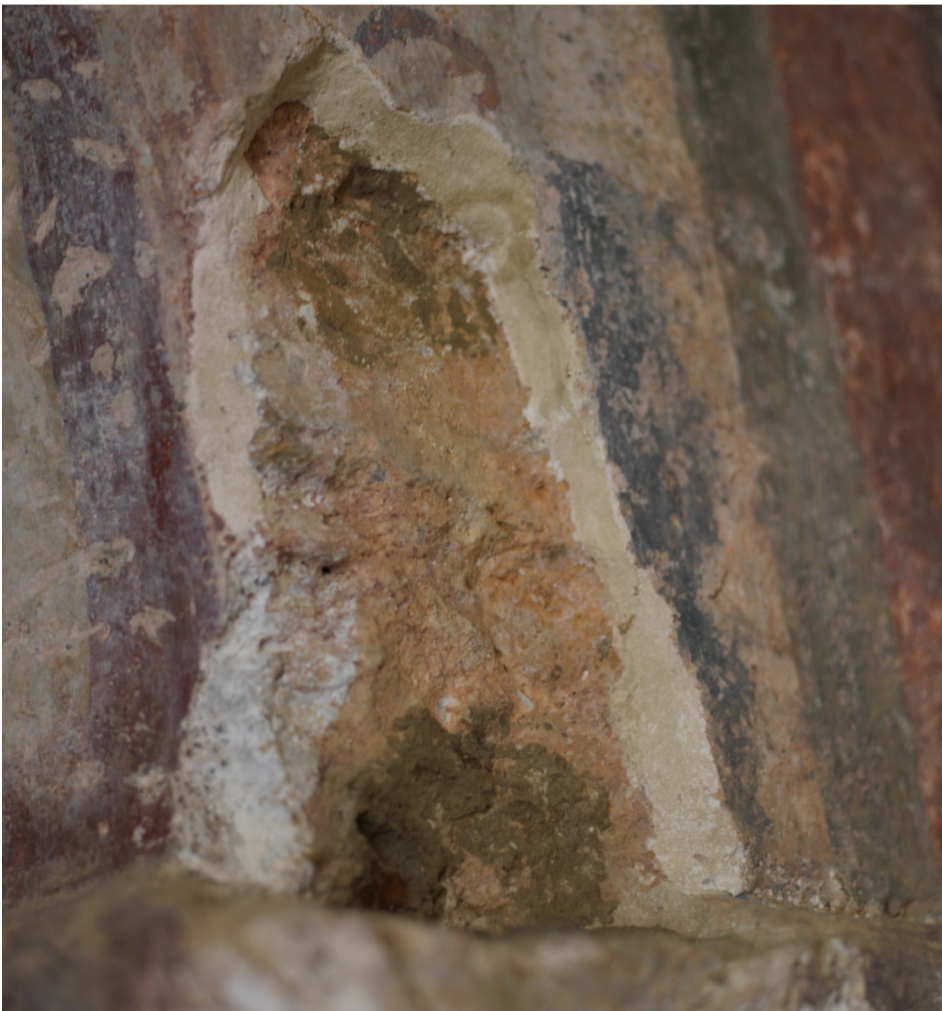
Skade som viser tykkelse på pusslagene ,samt det ytterste malelaget på ca 2,0mm