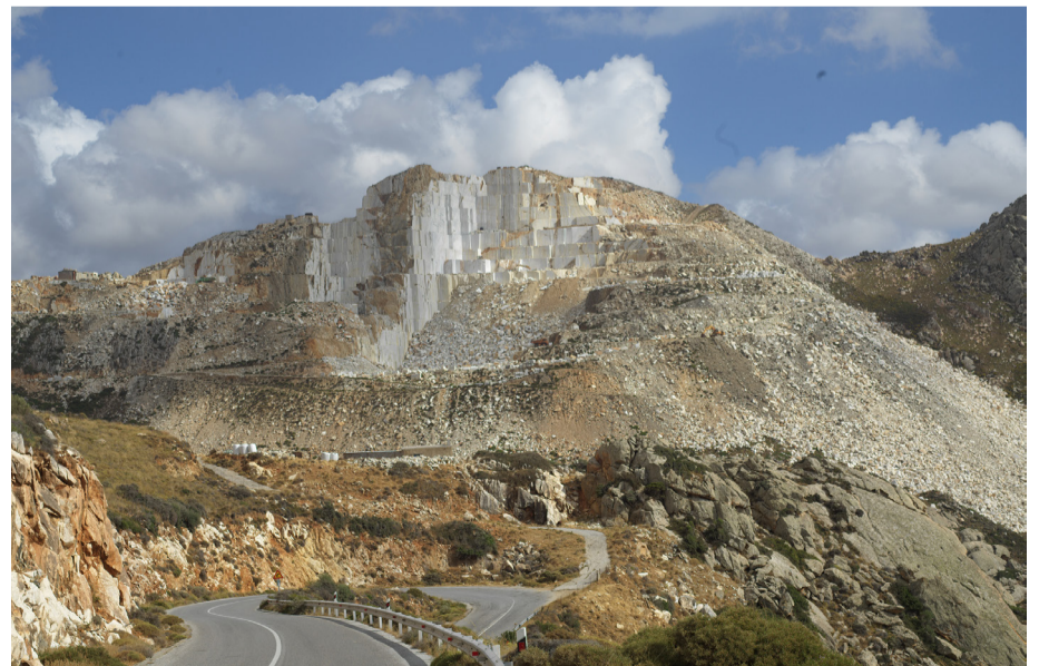
Church of Panagia Drossiani og det nærliggende kalkbruddet der mye av steinen er hentet fra.