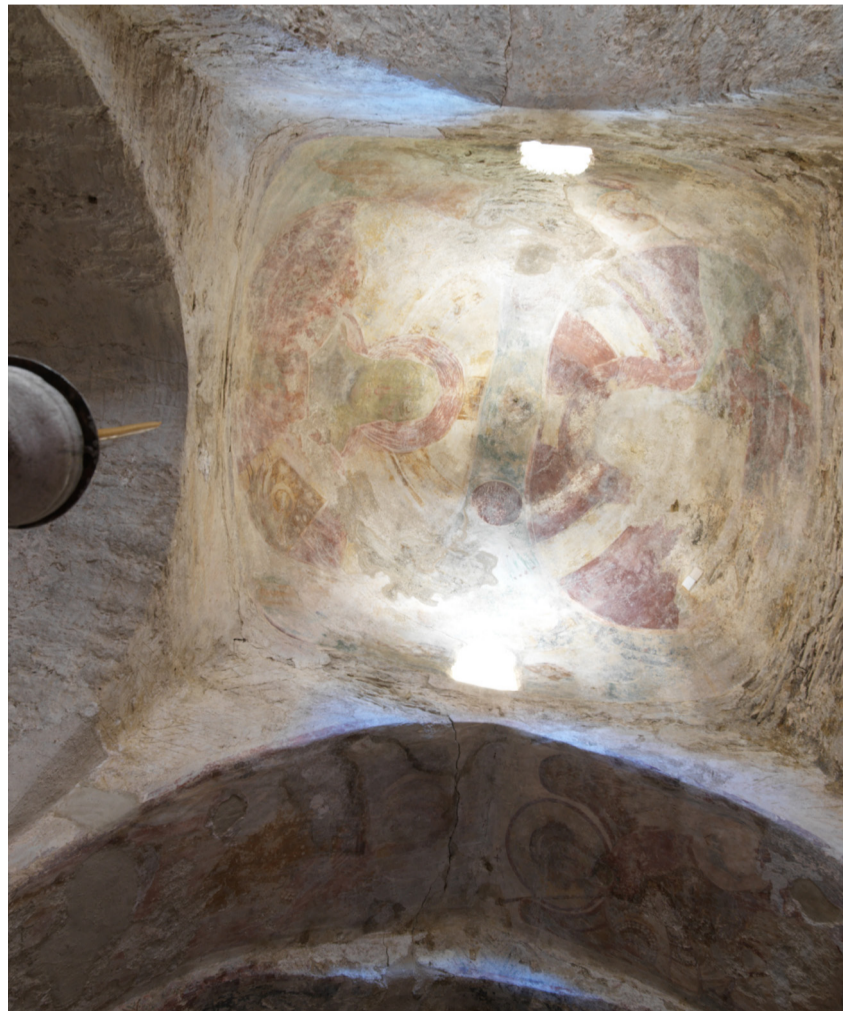
Freskomaleri i taket på apsis