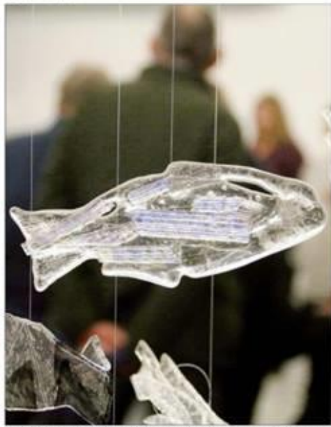
LÅSE I GLAS Kunstner i mørke glas ser rødt for dei fleste av deltakerne. Handlinge laud på ulike glass og som valgt av kunstner for det til neste prosjekt.