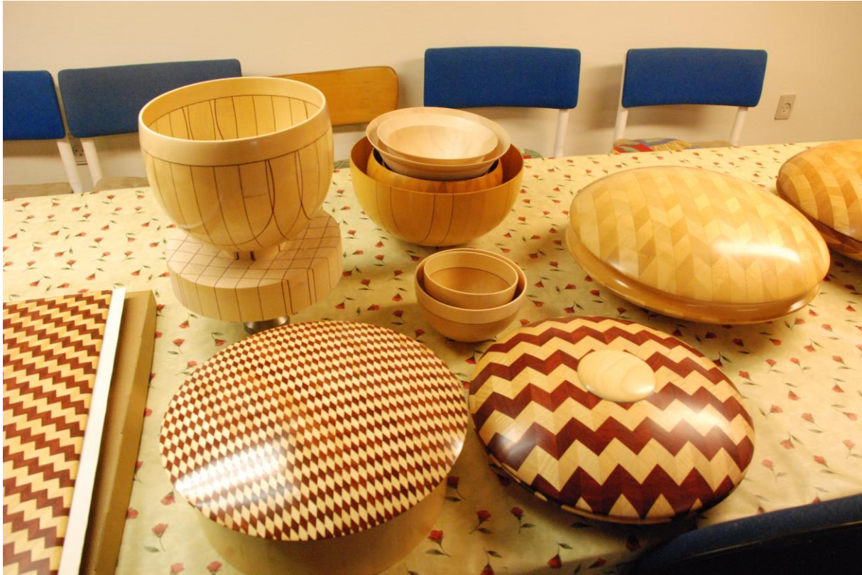
Skåler og smykkeskrin laget av Tyge Axel Holm fra Danmark.

Holm limer sammen lister i ulike farger for å skape ønsket mønster. Han bruker utendørslim for å unngå oppsprekking. Gjenstandene lakkres med lakkspøyte, opptil fem lag med syreherdende lakk med sliping mellom hvert lag.