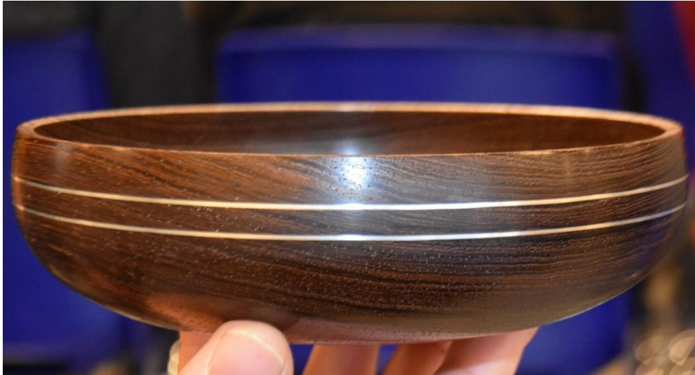
Innlagt sølvtråd på skål laget av Gunner Nygaard fra Danmark.