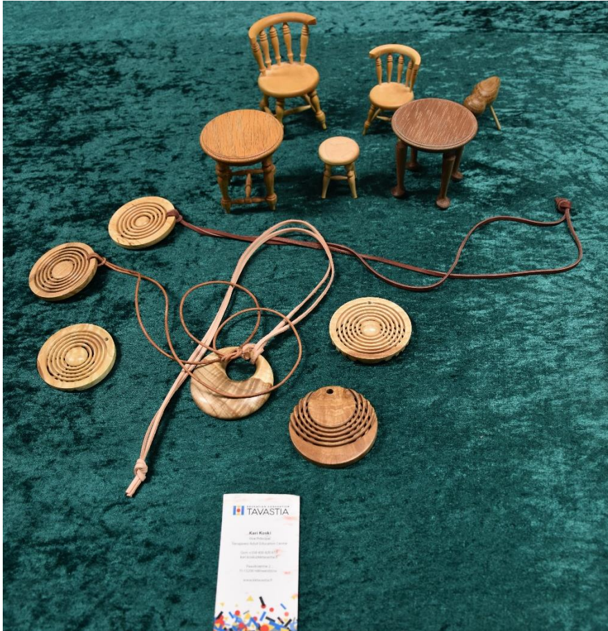
Smykker og miniatyrmøbler laget av Kari Koski fra Finland.