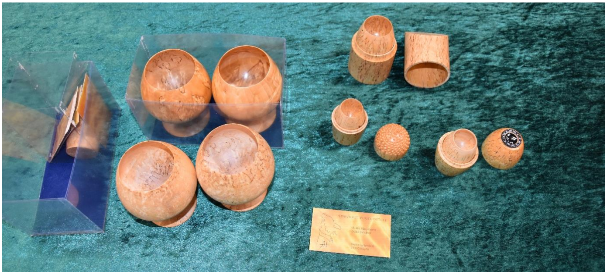
Drikkebegre i masurbjørk av Aulis Hakonen fra Köyliö i Finland.