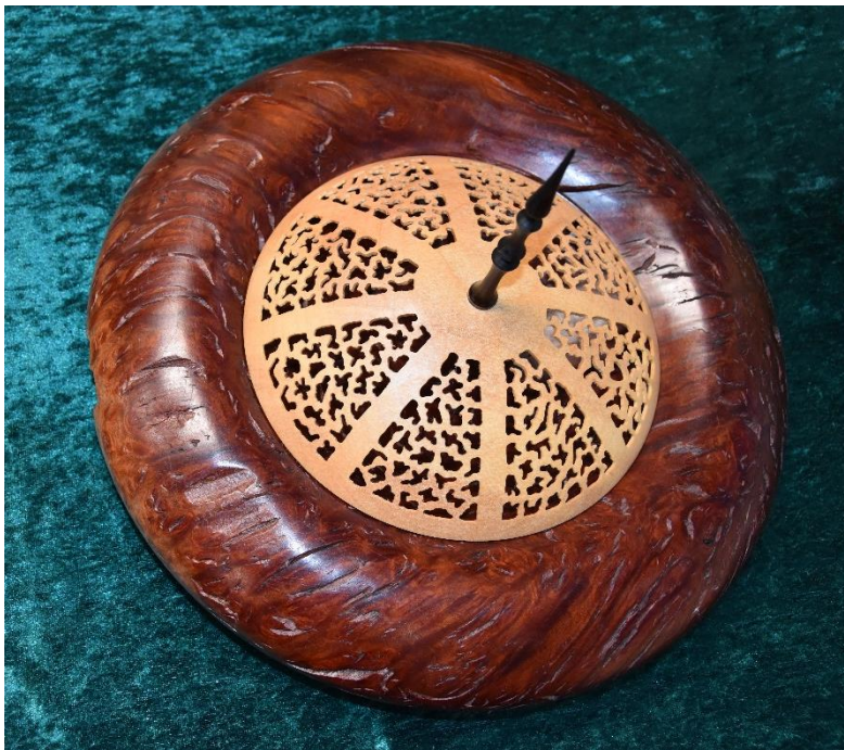
Fat med piercet lokk laget av Per Sepstrup fra Børkop i Danmark.