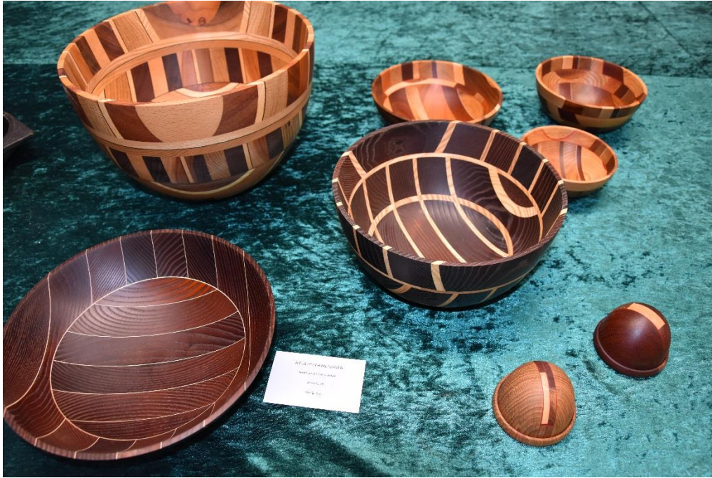
Skåler dreid av mønsterlaminerte emner av Niels Peder Miltersen fra Vodskov i Danmark.