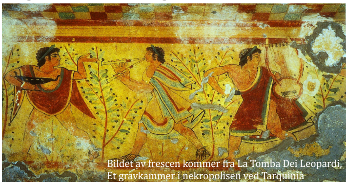
Bildet av frescen kommer fra La Tomba Dei Leopardi, Et gravkammer i nekropolisen ved Tarquinia