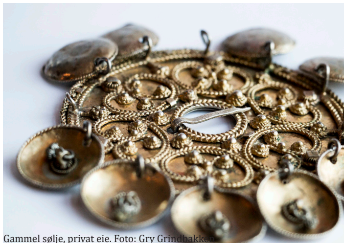
Gammel sølje, privat eie.