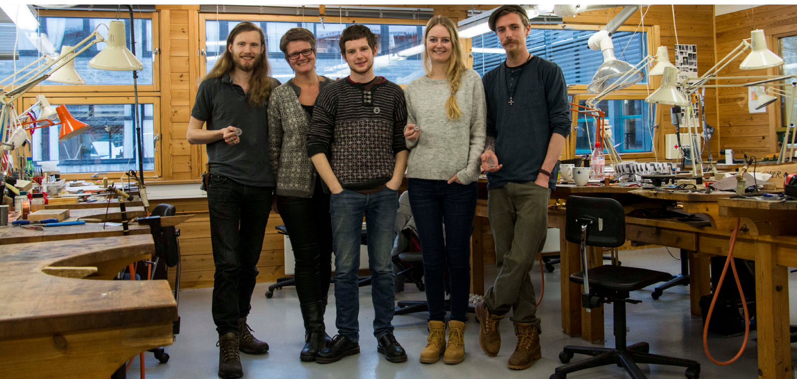
Førsteårsstudenter ved metallinja i Rauland