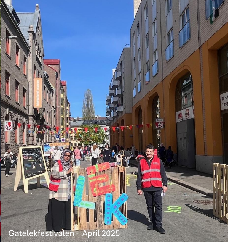
Gatelekfestivalen - April 2025