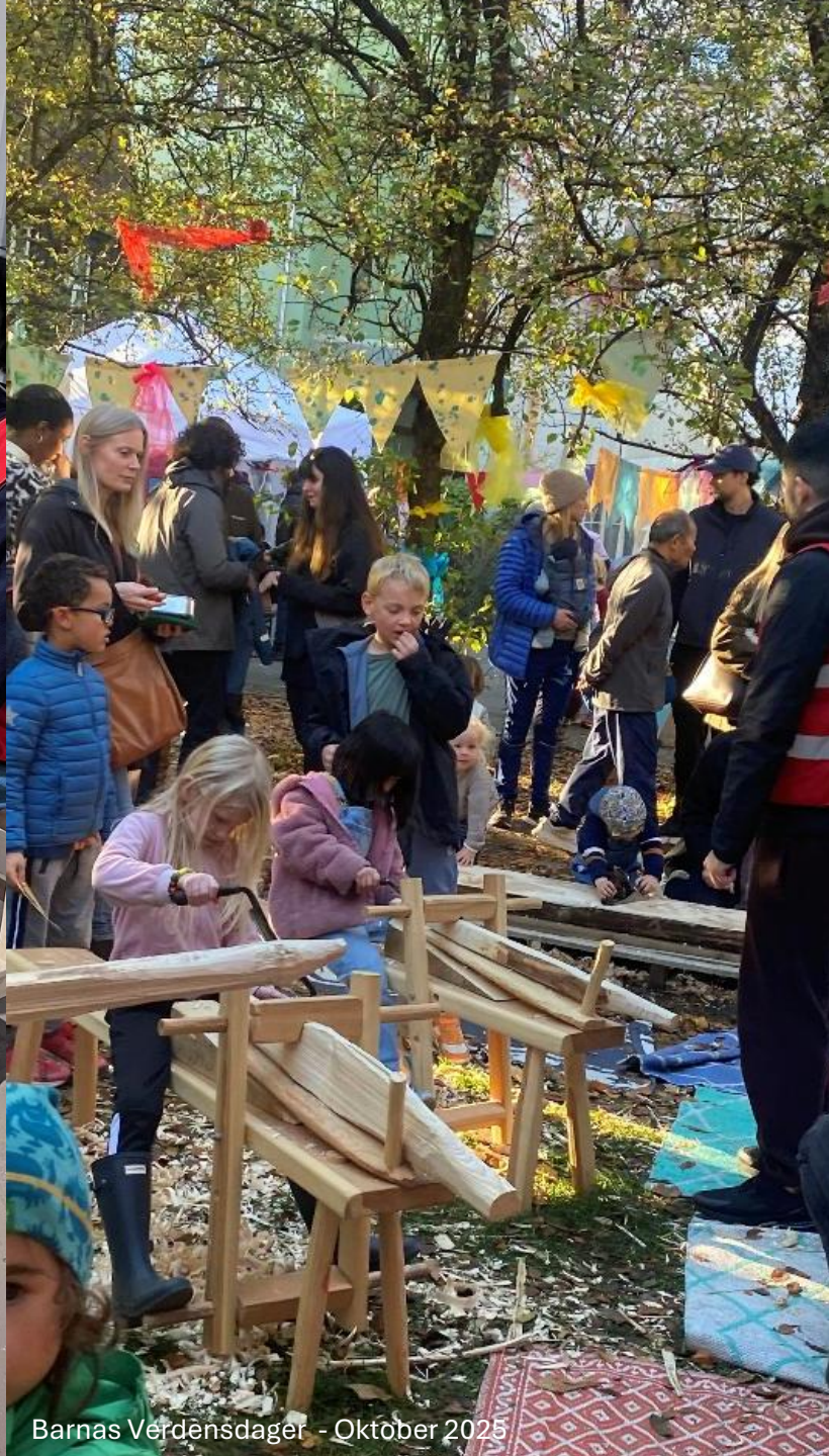
Barnas Verdensdager - Oktober 2025