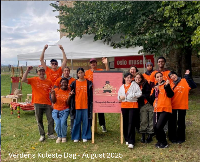
Verdens Kuleste Dag - August 2025