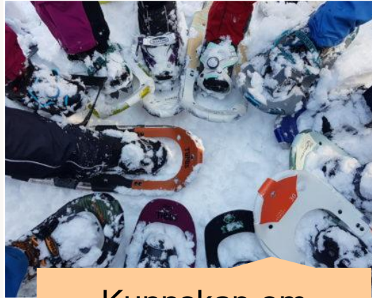
Kunnskap om naturen og universet