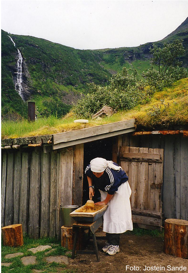
Setring / stølsdrift