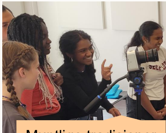
Muntlige tradisjoner og uttrykk