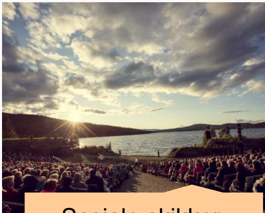
Sosiale skikker, ritualer og festiviteter