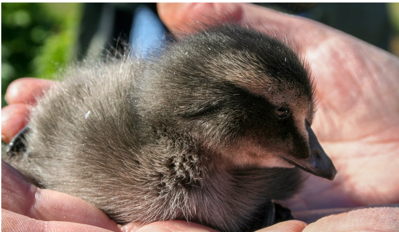
Kunnskap om naturen er viktig immateriell kulturarv. Ærfuglunge på Lånan.

Siden 2012 har Norsk håndverksinstitutt ledet redaksjonsrådet til #HeritageAlive, som er en journal for de UNESCO-akkrediterte NGO-ene. Redaksjonen har gitt ut flere titler i bokform. Målet med journalen er å dele metodikk og erfaringer med vern av den immaterielle kulturarven