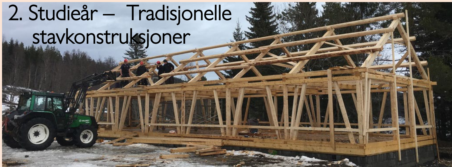
2. Studieår – Tradisjonelle stavkonstruksjoner