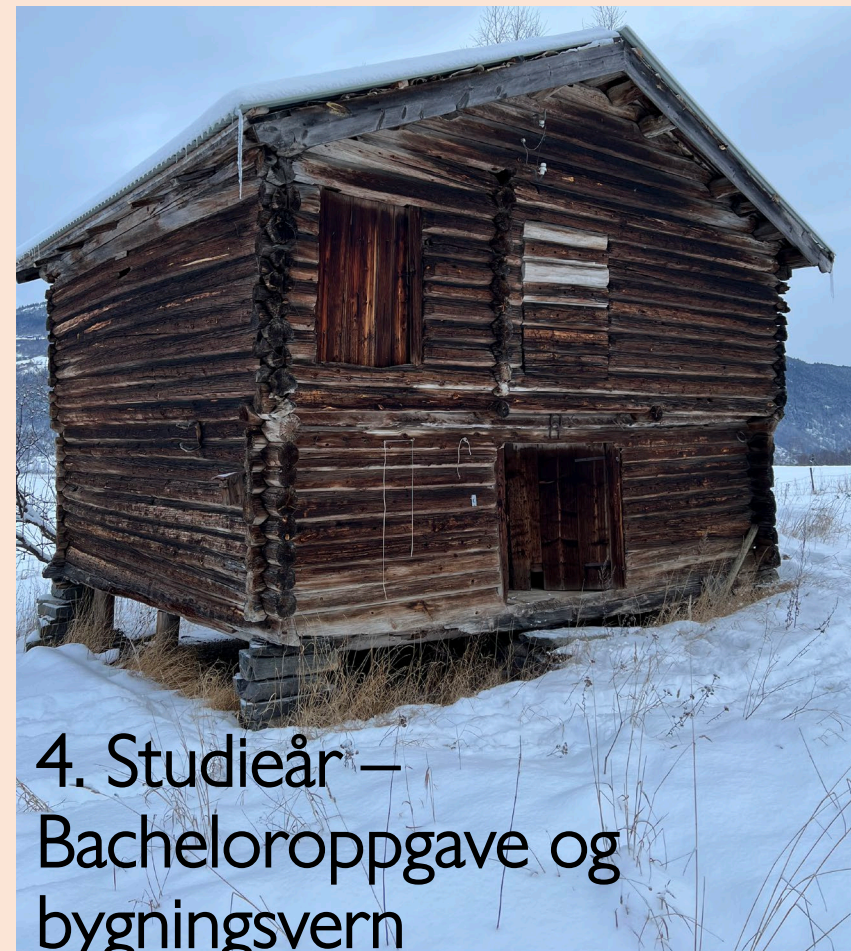
4. Studieår – Bacheloroppgave og bygningvern