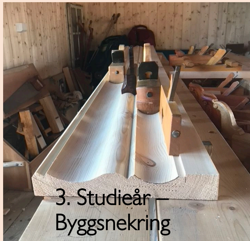
3. Studieår – Byggsnekring