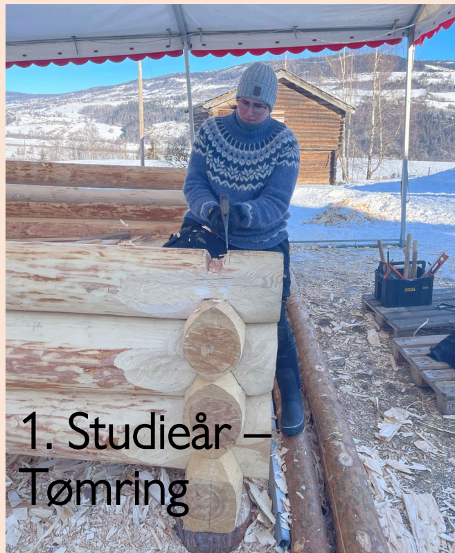
1. Studieår – Tømring