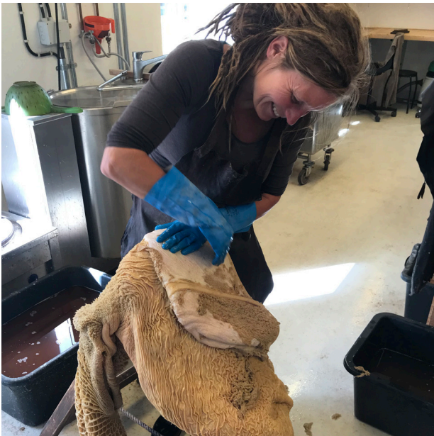
Skjåskinn, fjerning av tarmtotter.

dereført i 2020. Kulturminnet har fått midler til restaurering av verksted fra Vestland fylkeskommune, og dokumentasjon av produksjon vil skje når restaurering er ferdig i 2021.