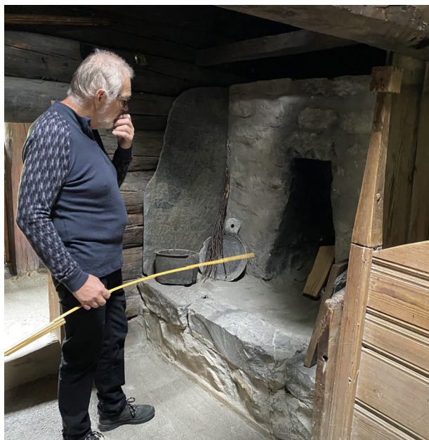
Oppmåling av røykovn på Maihaugen

av tradisjonshåndverk i museumsbutikker. Oppstart 2020, går videre i 2021. Dette prosjektet presenteres nærmere under seksjonen for Løfte håndverket i denne årsmeldingen.