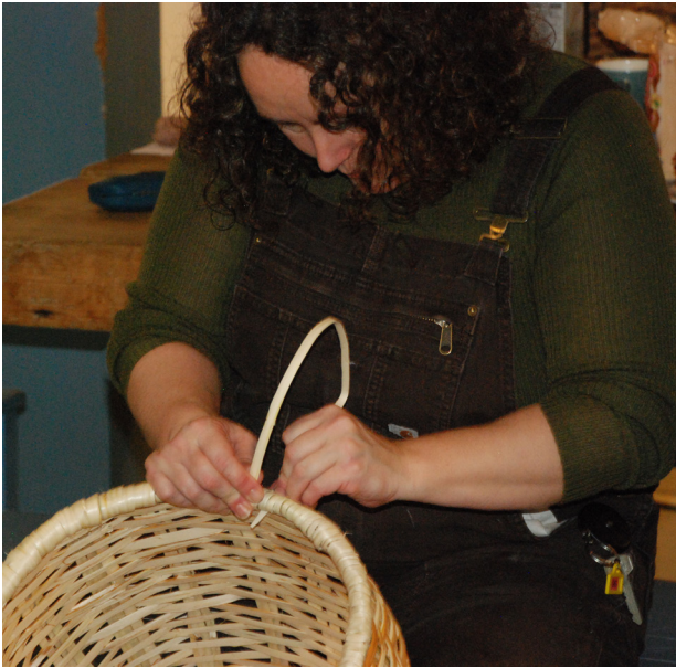
Hege «syr» kant på «sniken»- kurvtype som tidligere ble brukt til å bære fisk i. Flettet av delt materiale av hegg.