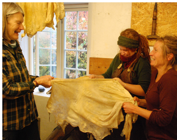
Garvermestere fra Sverige, Finland og Norge strekker et garvet skinn. Prosjekt om garving med fett lagt til ULU i Vågå, Innlandet, i september. ULU hadde i 2021 to lærlinger i garverfaget.