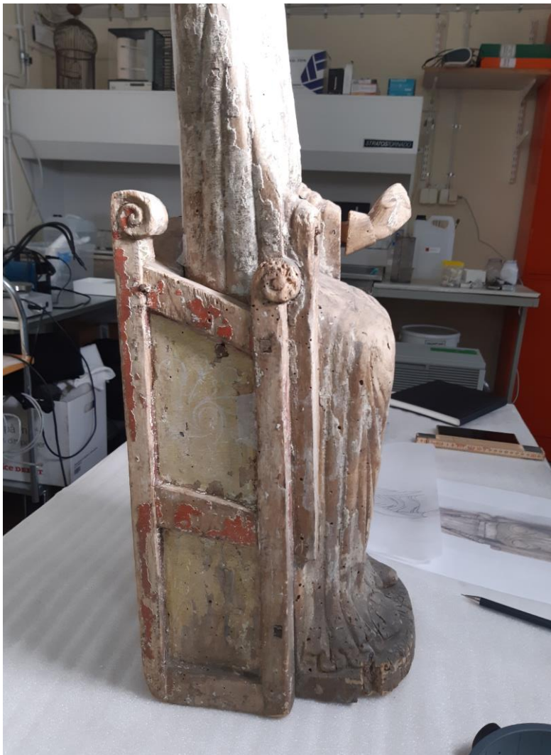
Detalj bilde av den originale Eljarömadonnaen.

«Eljarömadonnaen» har også opptatt meg det siste året. Dette er en romansk skulptur muligens utført i lind, som befinner seg på Historiska museet i Lund. Figuren her antakelig nokså tidlig i sitt liv, blitt omarbeidet til en mannlig helgen, muligens Olav den hellige. Hennes lange fletter har blitt frisert til en kort pasjeklipp, og hennes bryster har også gjennomgått litt kirurgi. Hun har fått skjegg, og omarbeidet serken sin. I stedet for et Jesusbarn på fanget, har hun nok fått en øks i neven, men denne finnes ikke lengre. Jeg har hatt gode muligheter til å studere skulpturen nøye, og arbeider for tiden med utkast til hvordan hun opprinnelig kan ha sett ut.