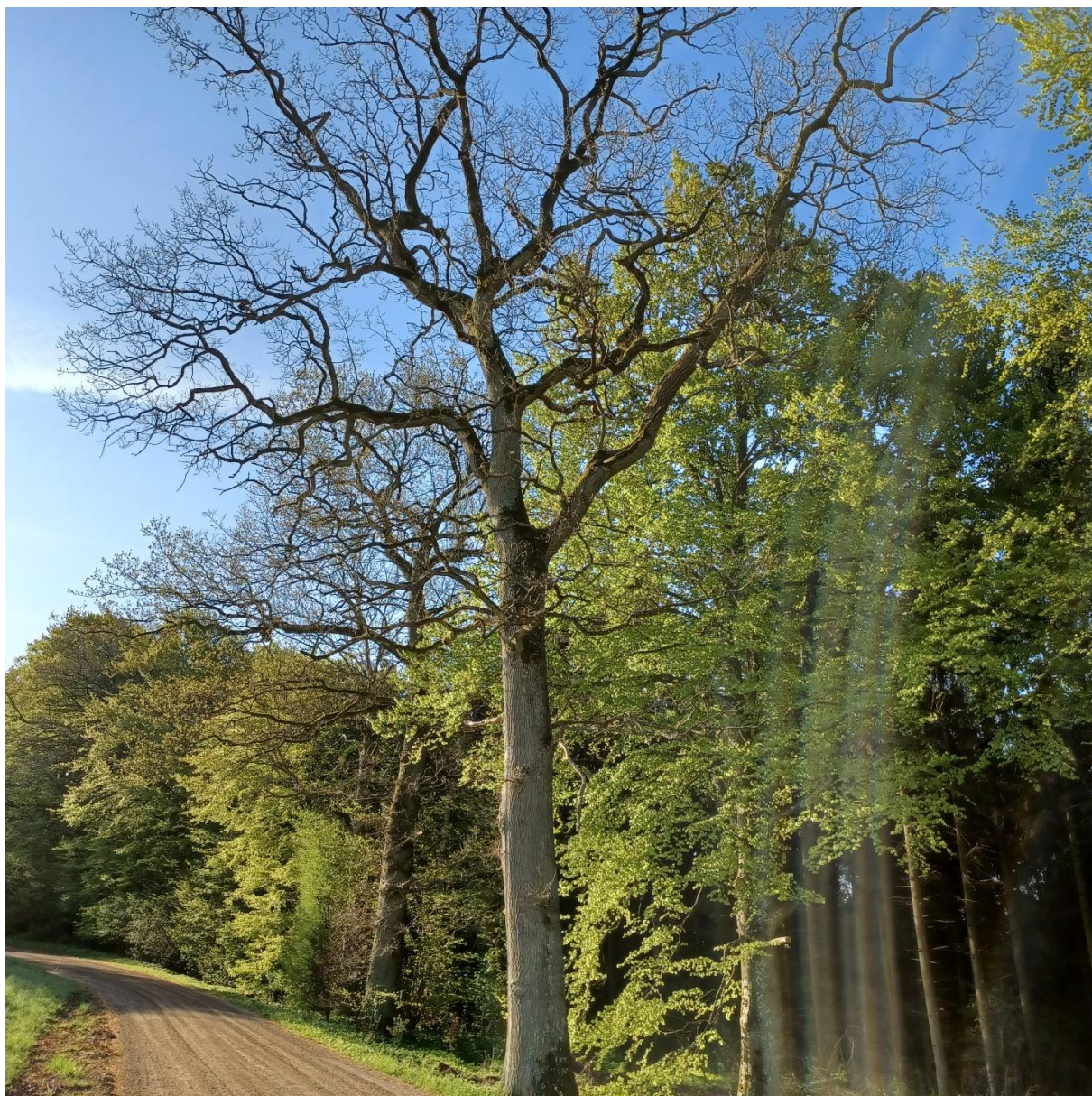
Trær som nesten ikke lenger finnes ...

Til byggingen av den nye Gokstadskipkopien som foregår i Tønsberg i disse dager, ble jeg spurt om jeg kunne overse fellingene av en del svære eiketrær, som skulle foregå et steinkast unna der jeg bor, og om jeg kunne plukke ut emner til bordganger, spant og knær fra disse. Det er med vemod man ser slike giganter gå i bakken, men trøsten er jo at de materialene og verdiene som ligger i disse trærne, blir brukt til noe nyttig og bra. Det var noen spennende dager i skogen.