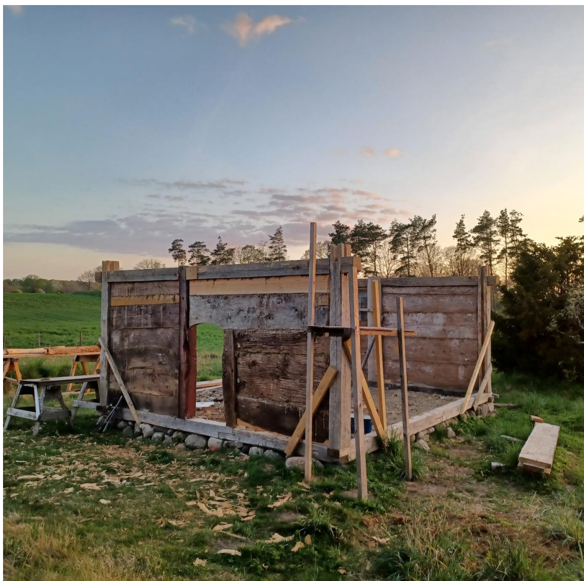
Underveis i arbeidet.

Dette prosjektet, som i utgangspunktet skulle handle om at jeg skulle ha noe å drive med, da koronaen satte inn, og verden holdt pusten, har vokst seg så stort, og blitt så omfattende, at jeg kjenner jeg sliter med å gi en rask oppsummering her. Det jeg kan si er at det fortsetter, og det blir bare mer og mer spennende og interessant. Kort fortalt fant jeg et hus som skulle rives og videre på dynga, jeg spurte om å få kjøpe rivningsmaterialet, og det var greit. Siden viste det seg at dette huset hadde uendelig mange historier å fortelle, om mange hus, om ulike måter å bygge på, og om en lang historie. Prosjektet er å få i hop et lite hus av vrakrestene, og å bruke fragmentene, og arbeidet med dem, til å lære.