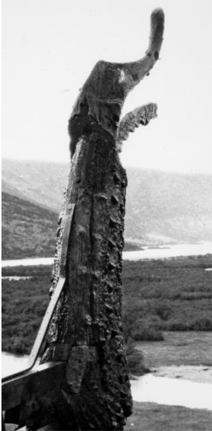
Gavldragen fra Lom. Et av de vakreste fragmenter vi har bevart i tre fra middelalderen.