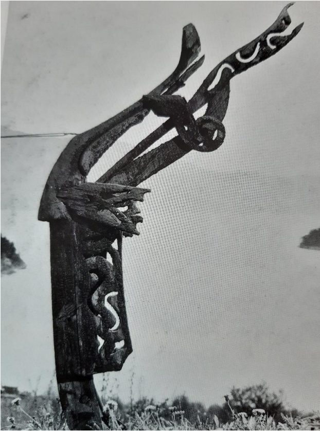
Gavldragen fra Borgund. En av de få bevarte gavldragene fra middelalderen. Her er nesesylingen snudd feil vei. (Arkivfoto)