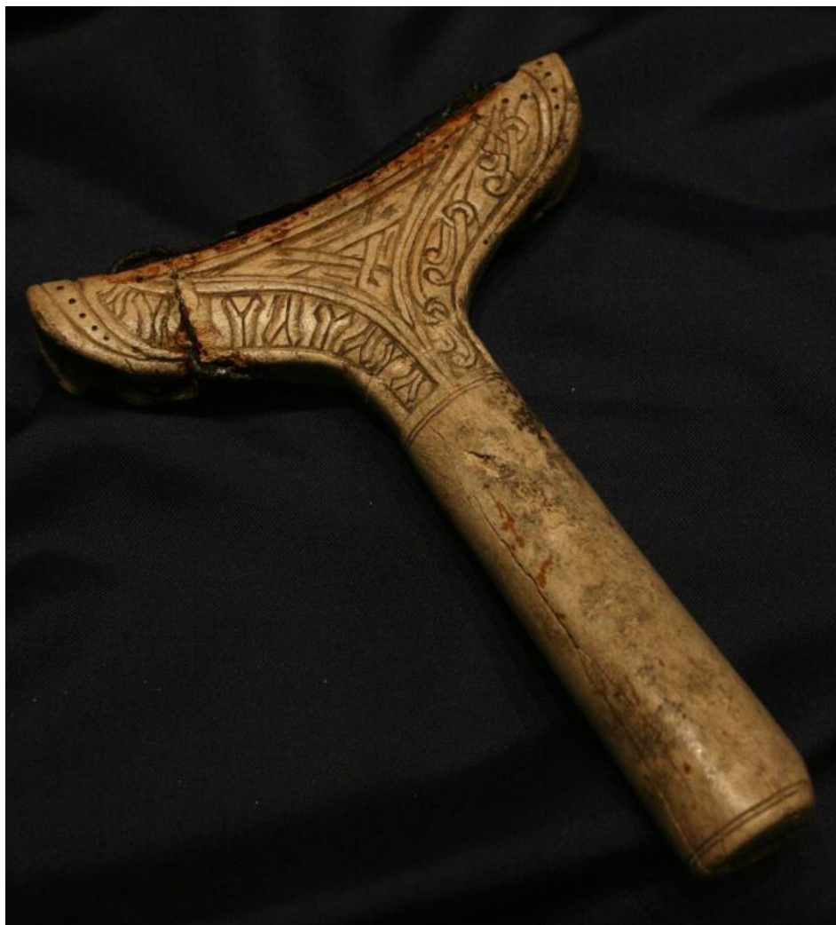
Runebommehammeren fra Rendalen. Et kulturelt møte mellom samisk og norrøn kultur i middelalderen.