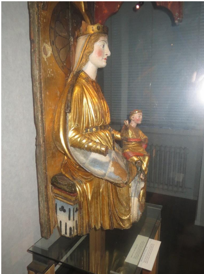
Hovemadonnaen. Til tross for at hun har blitt avkortet, er hun blant de fineste gotiske skulpturer i Norge, med en særdeles fin polykromi bevart.

bruksgjenstander, dog med et åndelig innhold, mer enn et praktisk. Kulturminne var aldri en av deres tiltenkte funksjoner. Det er en egenskap vi tillegger dem. Og denne mutilasjonen av madonnaen, som en gang hendte, er med stor sannsynlighet årsaken til at den fortsatt finnes, og at vi nå kan nyte det utsøkte arbeidet. Hadde ikke mannen med øksa, den gang ment at den var verd å fortsatt bruke, selv om den da måtte tilpasses litt formatmessig, så er det ikke godt å vite hva som ville skjedd med den. For ham, -mannen med øksa-, utgjorde madonnaen en vel så god jobb som kultobjekt, om enn beina manglet.