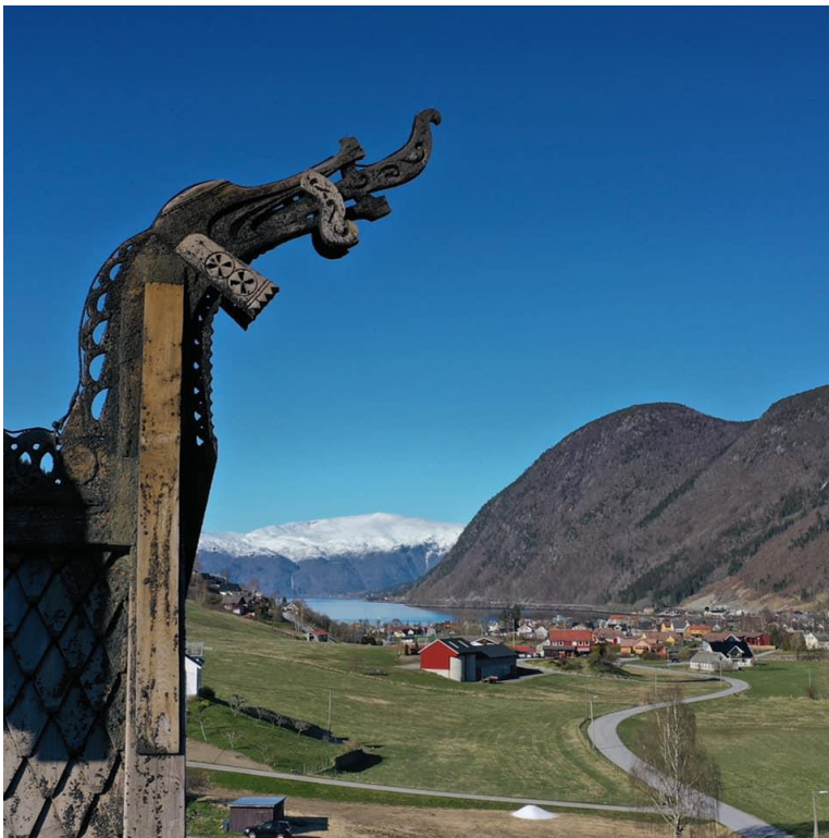
Gavldrage på Hopperstad stavkirke. Den omvendte nesesylingen har etablert seg.