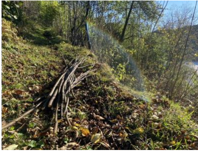
Hausting av materiale