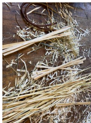
Arbeid med vedmeis