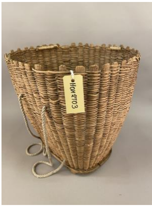
Kipe på Hordamuseet