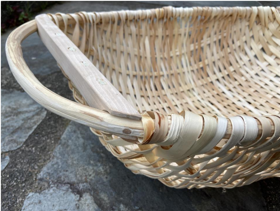
Kolvfat – namnet seies å komme av kvelving, forma på korga.