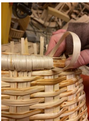
Syng av kant på snik