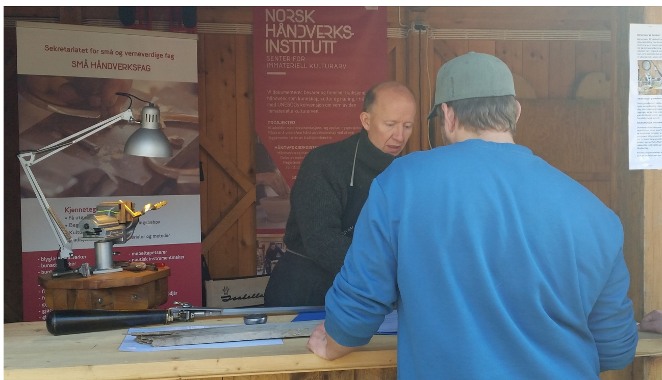
Stipendiat i børsemakerfaget forklarer arbeidsmomenter til publikum på Håndverkstunet under Dyrskun i Seljord, Telemark.

Under arrangementet Yrkesfestivalen i Sandnes i juni, deltok Håndverksinstituttet sammen med en kostymesyer fra Agder Teater. Ungdom fra skoler i regionen kunne denne dagen få informasjon om ulike utdanningsmuligheter. Norsk håndverksinstitutt gjennomførte i 2018 og 2019 et opplæringsprosjekt om