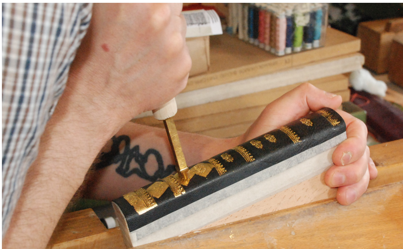
Håndbokbinding og forgylling.