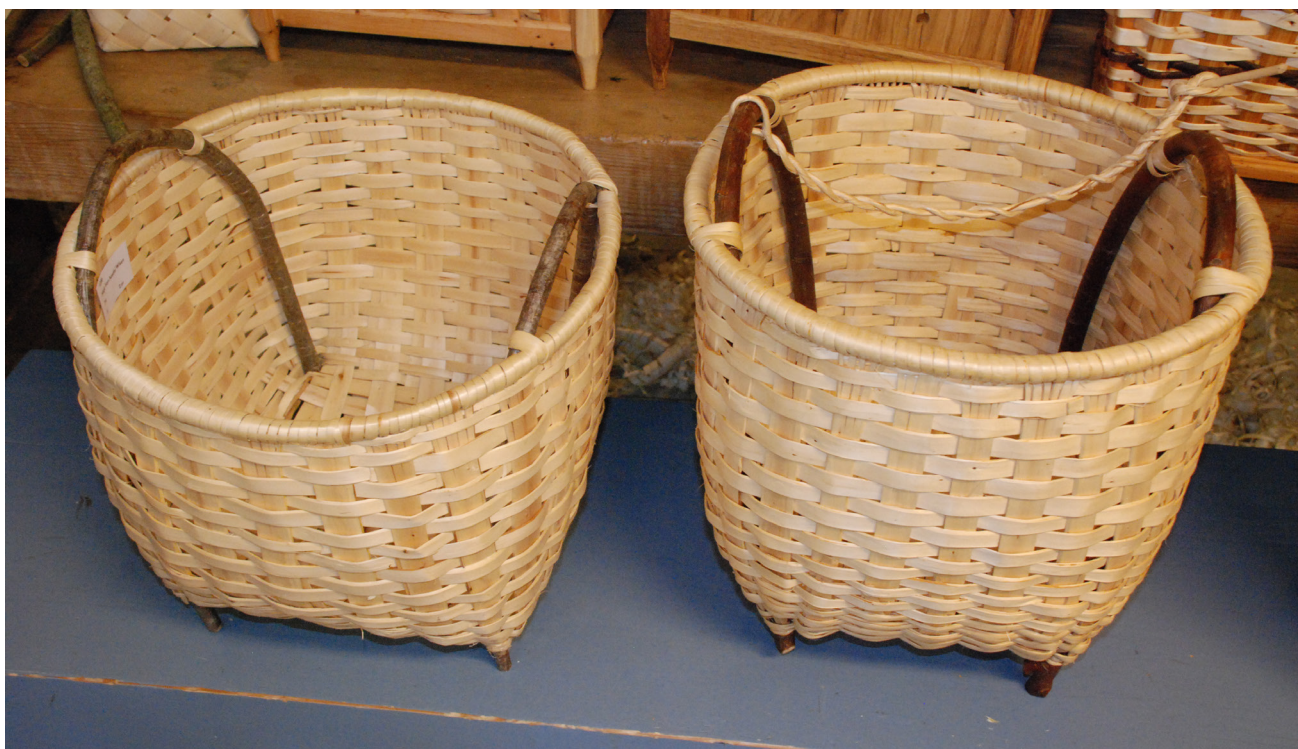
Norsk håndverksinstitutt ved SSV har i perioden 2017-2020 ansvar for opplæringsprosjekter innen korgmakerfaget. Hensikten er å gjøre nåtidige kurvmakere kjent med tradisjonelle kurvtyper laget av lokale treslag.