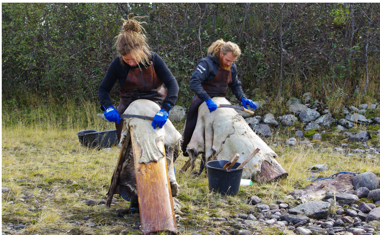
Vegetabilsk garving og skinnbearbeiding, Vågå.