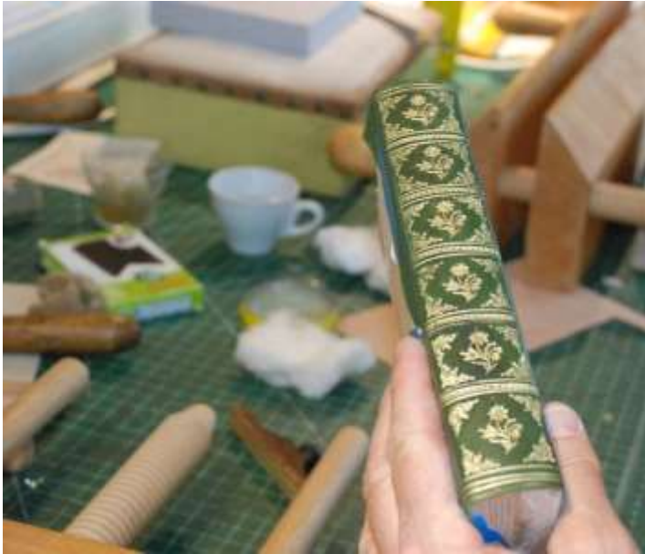
Eksempel på håndforgylt bokrygg.