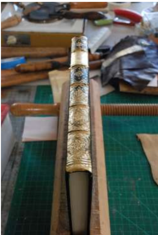
Overflødig gull er delvis fjernet fra bokryggen.